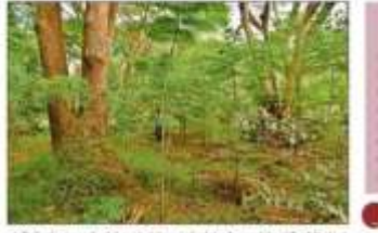
ಮಂಗಳೂರಿನಲ್ಲಿಯೂ ಮಹಾ ವೃಕ್ಷೋತ್ಸವಿಗಿಳಿಸುತ್ತಿದ್ದಾರೆ

ಪಾಲಿಕೆ ಜಾಗದಲ್ಲಿ ಯೋಜನೆ ಮಂಗಳೂರಿನಲ್ಲಿಯೂ ಮಹಾ ವೃಕ್ಷೋತ್ಸವಿಗಿಳಿಸುತ್ತಿದ್ದಾರೆ. ಇದರ ಮೂಲಕ ಮೊರ್ಚೆ ಗಿಡಗಳನ್ನು ಸುಸ್ಥಗೊಳಿಸುತ್ತಾರೆ.