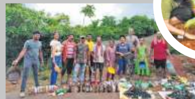
Jeeth along with volunteers and schoolchildren, cleaning up forest spaces and planting saplings during a forest cleaning project