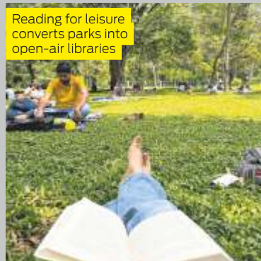
Reading for leisure converts parks into open-air libraries