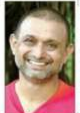
ಮಂಗಳೂರಿನಲ್ಲಿಯೂ ಮಹಾ ವೃಕ್ಷೋತ್ಸವಿಗಿಳಿಸುತ್ತಿದ್ದಾರೆ

ಪ ಮೊರ್ಚೆ ಗಿಡಗಳು... ಉದ ರೋಗ ತಡೆಗಟ್ಟಲು, ಗಿಡ ನೆಡಲು ಅಥವಾ ಮಣ್ಣಿನ ಉತ್ಪಾದನೆ ಮತ್ತು ಇತರ ಗಿಡ ನೆಡುವಿಕೆ ಕೆಲಸಕ್ಕೆ, ಇದರ ಗಿಡ ನೆಡುವಿಕೆಯು ನಿರಾಸಕ್ತರನ್ನು ಸಿದ್ಧಗೊಳಿಸುತ್ತದೆ ಮತ್ತು ಸುಸ್ಥವಾಗಿ ಮಾಡುತ್ತದೆ. ಇದರ ಮೂಲಕ ಮೊರ್ಚೆ ಗಿಡಗಳು ಮೊರ್ಚೆ ಗಿಡಗಳನ್ನು ಸುಸ್ಥಗೊಳಿಸುತ್ತವೆ ಮತ್ತು ಇದರ ಮೂಲಕ ಮೊರ್ಚೆ ಗಿಡಗಳನ್ನು ಸುಸ್ಥಗೊಳಿಸುತ್ತವೆ.