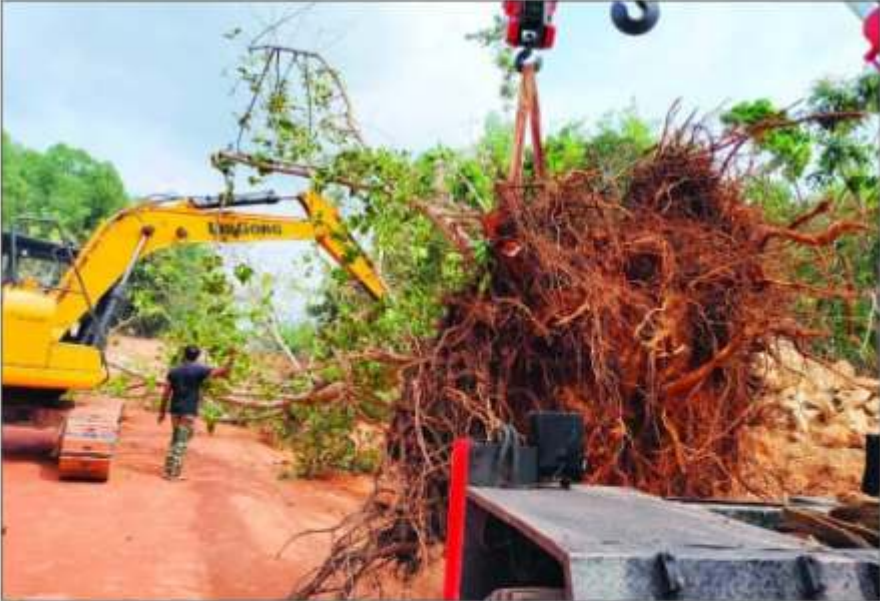
ಕಾರ್ಕಳ-ಮಾಳ ಹೆದ್ದಾರಿ ಅಗಲೀಕರಣ ಓಸೆಲೆ ಮರಗಳನ್ನು ಸ್ಥಳಾಂತರ ಮಾಡುವ ಕಾರ್ಯ ನಡೆಯಿತು.

ಅರಣ್ಯ ಇಲಾಖೆ ಮಾಳ ಗೇಟ್ ನಿಂದ ಕಾರ್ಕಳ ಬೈಪಾಸ್ ವರೆಗಿನ ಸುಮಾರು 11 ಕಿಮೀ ವ್ಯಾಪ್ತಿಯಲ್ಲಿ ಒಟ್ಟು 1634 ಮರಗಳ ಬದಲಿಗೆ ಅದರ 10 ರಷ್ಟು ಗಿಡಗಳು ಅಂದರೆ 16340 ಗಿಡಗಳನ್ನು ನೆಡಲು ಗಿಡವೊಂದರಿಂದ 411.21 ರು. ದರ ನಿಗದಿಪಡಿಸಿದೆ. 1 ಕಿ ಮೀ ವ್ಯಾಪ್ತಿಗೆ 9, 06,050 ಹಣ ಪಾವತಿಸಿದ್ದು ,11 ಕಿಮೀ ಗೆ 1,07,92,868 ಹಣ ಪಾವತಿ ಮಾಡಲಾಗಿದೆ. 1051 ಮರ ಕಡಿದು ನಾಟ ಸಂಗ್ರಹಾಲಯಕ್ಕೆ ಸಾಗಿಸಲು ಒಟ್ಟು 4,52,369 ರು. ಪಾವತಿಸಲಾಗಿದೆ. ರಾಷ್ಟ್ರೀಯ ಹೆದ್ದಾರಿ ಕಾಮಗಾರಿಗಾಗಿ ಮರಗಳ ತೆರವು ಹಾಗೂ ನಿರ್ವಹಣೆ, ಹೊಸ ಗಿಡನೆಡಲು ಒಟ್ಟು 1,79,65,388