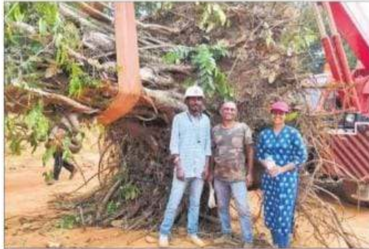
ಪರಿಷದ ಪ್ರಿಯರಿಂದ ಸ್ಥಳಾಂತರಗೊಂಡ ಮರ.

ಮರಗಳ ಸ್ಥಳಾಂತರಕ್ಕೆ ಒಣಗಿಸಿದ ಅಶೋಕಾಂಕಿ ತಿಂಗಳ ಹೆಚ್ಚು ಪ್ರತಿಭಟನೆಗಳಿದ್ದು, ಆದರಿಂದ ಬೆಳೆಗೆ, ಬಿಸಿಲಿನ ರೂಫ್ ಹುಟ್ಟುತ್ತಿದ್ದು ಮರಗಳಿಗೆ ನೀರಿನ ಅಭಿಮಾನಿ ಸಾಕಷ್ಟು ಪ್ರಮಾಣದಲ್ಲಿ ಸಿಗುತ್ತಿಲ್ಲ. ನೀರಿನ ಟ್ಯಾಂಕ್ ಮೂಲಕ ನೀರು ಉಳಿಸಲಾಗುತ್ತಿದೆ. ಕೆಲವು ಪರಿಷದ ಪ್ರಿಯರು ನೀರು ಗೊಬ್ಬರ ವ್ಯವಸ್ಥೆ ಮಾಡಿದ್ದರೂ ಬೆಳೆಗಲಿಯಲ್ಲಿ ಸ್ಥಳಾಂತರಗೊಂಡ ಮರಗಳು ಜೀವಂತ ಉಳಿಯುವುದು ಕಷ್ಟ