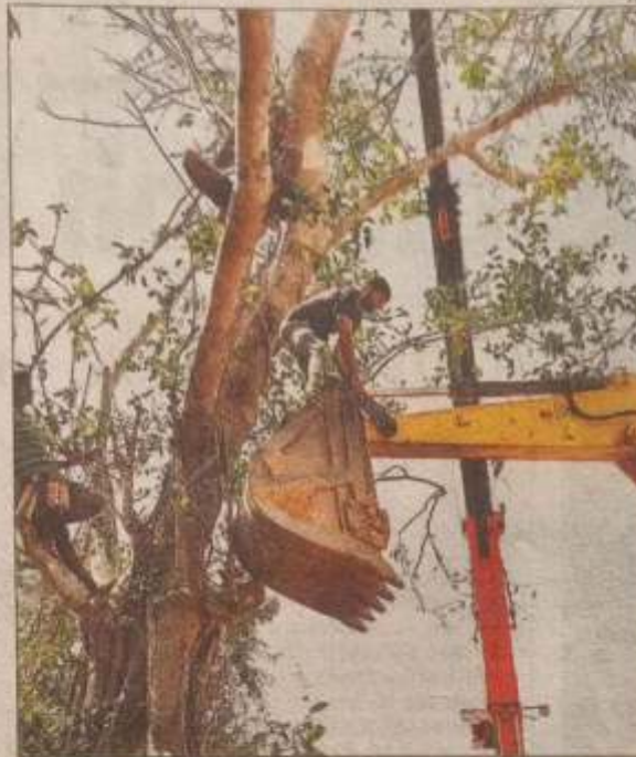
SECOND INNINGS: A tree on Karkala-Mala stretch being translocated

Roche said the post-translocation phase is critical, as these trees typically require about two years of care, especially in the face of potential challenges such as heatwaves, which can increase the risk of casualties. "Our observations indicate a higher survival rate among the ficus