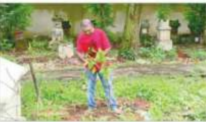
ಮಂಗಳೂರಿನಲ್ಲಿಯೂ ಮಹಾ ವೃಕ್ಷೋತ್ಸವಿಗಿಳಿಸುತ್ತಿದ್ದಾರೆ