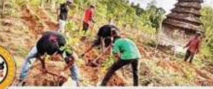
ಗಿಡ ನೆಡಲು ಮಾರ್ಚೆ ಕೆಲಸಕ್ಕೆ ಇದು ಮಂಗಳೂರಿನಲ್ಲಿಯೂ ಮಹಾ ವೃಕ್ಷೋತ್ಸವಿಗಿಳಿಸುತ್ತಿದ್ದಾರೆ. ಇದರ ಮೂಲಕ ಮೊರ್ಚೆ ಗಿಡಗಳನ್ನು ಸುಸ್ಥಗೊಳಿಸುತ್ತಾರೆ.