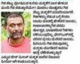
ಮಂಗಳೂರಿನಲ್ಲಿಯೂ ಮಹಾ ವೃಕ್ಷೋತ್ಸವಿಗಿಳಿಸುತ್ತಿದ್ದಾರೆ

ಮೊದಲು ಮೊರ್ಚೆ ಗಿಡ ನೆಟ್ಟು ಮಕ್ಕಳಿಗೆ ಮಾದರಿಯಾಗಲಿ