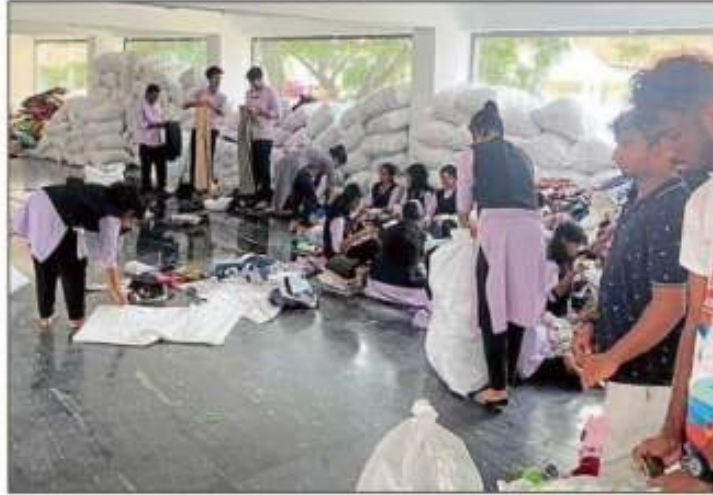
ಬಟ್ಟೆ ಗುಣಮಟ್ಟ ಪರಿಶೀಲಿಸಿ ವ್ಯಾಕಿಂಗ್ ಕಾರ್ಯದಲ್ಲಿ ತೊಡಗಿರುವ ಮಂಗಳೂರಿನ ರೋಶನಿ ನಿಲಯದ ವಿದ್ಯಾರ್ಥಿಗಳು

ಅಭಿಯಾನವು ತನ್ನ ಹರವನ್ನು ವಿಸ್ತರಿಸಿಕೊಂಡಿದೆ. ಅರು ತಿಂಗಳ ಹಿಂದೆ 'ಫಾರ್ ಅವರ್ ಸಿಸ್ಟರ್ಸ್' ಹೆಸರಿನಲ್ಲಿ ಅಭಿಯಾನ ಆರಂಭವಾದಾಗ, 23 ಸಾವಿರಕ್ಕೂ ಹೆಚ್ಚು ಸೀರೆಗಳು ಸಂಗ್ರಹವಾಗಿದ್ದವು. ಅವುಗಳಲ್ಲಿ ₹10 ಸಾವಿರಕ್ಕೂ ಅಧಿಕ ಮೌಲ್ಯದ ಸೀರೆಗಳು ಇದ್ದವು.